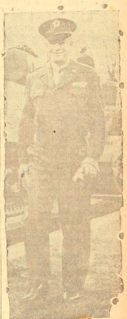
O general Dwight Eisenhower, comandante em chefe da invasão, está hoje na frente de Cherbourg de onde fogem os nazis

WASHINGTON, 10 (U. P.) — O major general Henry Miller, do Exército norte-americano, foi rebaixado a tenente-coronel e mandado regressar de Londres para os Estados Unidos porque em um "cock-tail" no mês passado revelou a data aproximada da invasão da Europa.