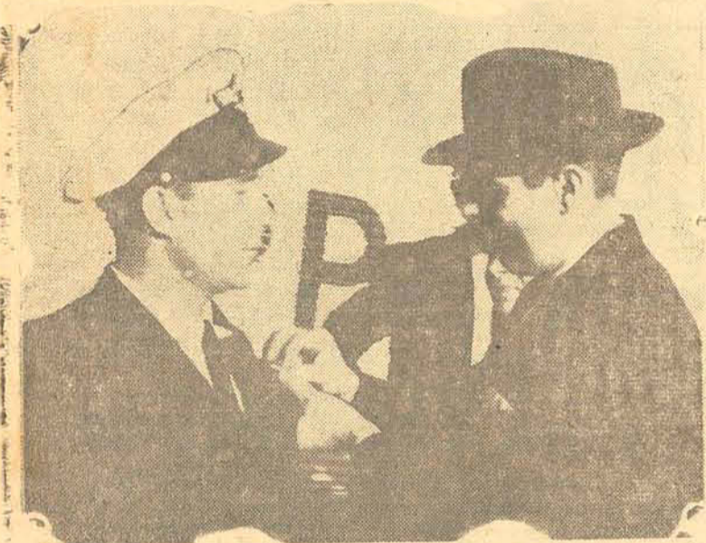
O 22º MILIONÁRIO DO AR

Rio, 7 (Press Parga) — Coincidindo quasi com a emissão de sua passagem n. 200.000 a que há dias atrás nos referimos, a companhia brasileira de Aeronavegação, "Cruzeiro do Sul" sagrou ontem, no aeroporto Santos Dumont, o seu 22º milionário do ar.