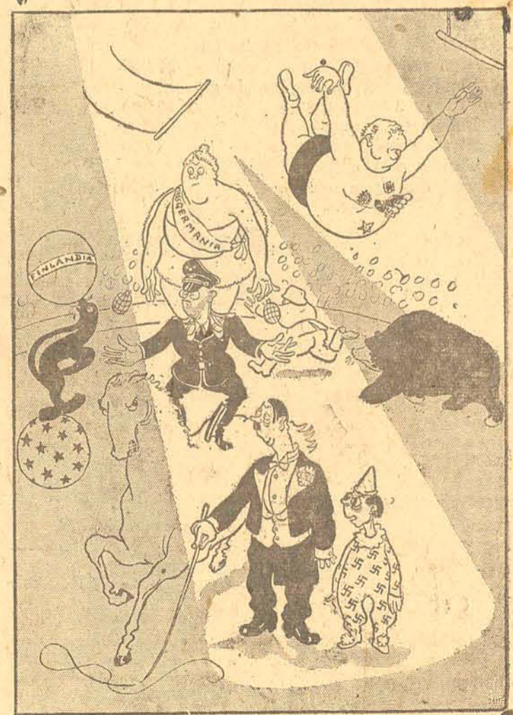
— "Foi uma idéia ótima fazer com que todos representem ao mesmo tempo".

Q. G. ALIADO NA ITALIA 26 (UP) — O comunicado de hoje diz que as forças do Quinto Exército penetraram em poderosas e pesadamente minadas posições nazistas.