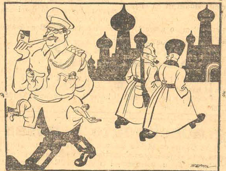
«Esse novo uniforme russo é notavel: cabe tuds nos bolsos...»