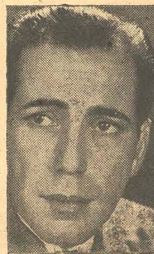
HJ MPHREY BOGART

SEMPRE UM BOM ESPETACULO NO MAIOR CONFORTO