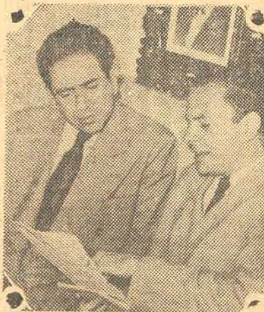
O embaixador do Mexico falando á imprensa.

MONTEVIDEO, 20 (U P) — O diário matutino «El País» informou que a renúncia do ministro argentino da Justiça e Educação, sr. Honorio Siqueira, teve lugar depois que o mesmo apresentara objeções á decisão do governo de excluir as crianças de origem judaica e inglesa das escolas primarias argentinas. O mesmo jornal informou que o diário de Corrientes, «La Mañana», foi suspenso pelo governo argentino por não ter publicado na integra o discurso de 14 do corrente do presidente Farrel.