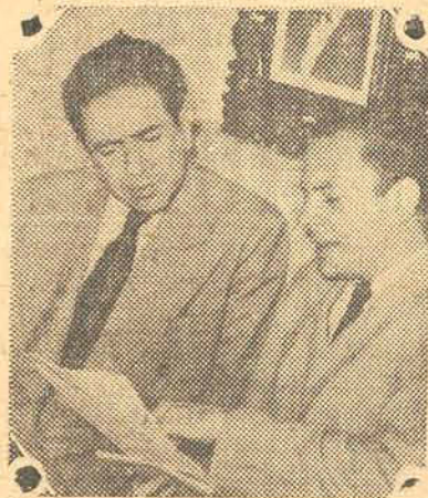
O embaixador do Mexico falando á imprensa.

docas de Sebastopol. Informa-se que há duas semanas os alemães e os rumenos desenvolvem frenéticos esforços para retirar parte do material de guerra pesado e as melhores unidades. A emissora de Moscou noticiou que os aviadores vermelhos afundaram cerca de oitenta navios inimigos na costa da Criméia, na primeira quinzena de abril.