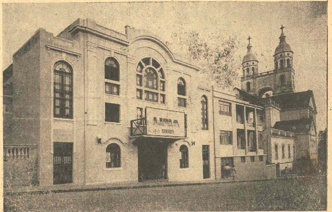
A fachada do Cine RITZ