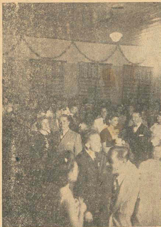
Aspecto do baile inaugural