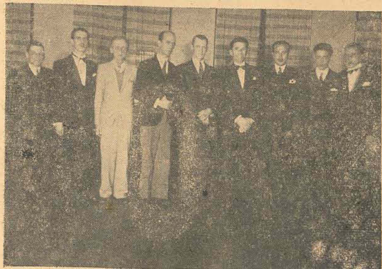
Diversos membros da 1a. Diretoria

Três anos de lutas, três anos de vitórias