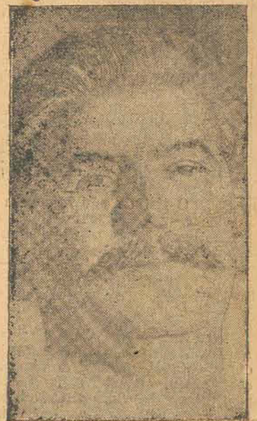
MARECHAL JOSEF STALIN—Dados biográficos na segunda página

Montevideu, 26 (U. P.) — Informou-se à última hora que a República Argentina rompera relações diplomáticas e comerciais com a Alemanha e o Japão.