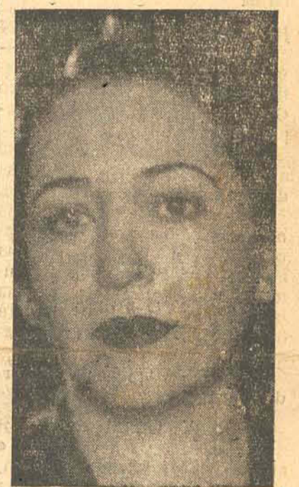
Transcorre hoje o aniversário natalício da Sra. Darcy Vargas. Todos os anos a Sra. Darcy Vargas, cujo nome está tão intimamente ligado a inúmeras obras e instituições de caridade, costuma receber as maiores e inequívocas provas de admiração e amizade, oriundas de todas as classes sociais e de todos os pontos do país. Este ano, todavia, tais homenagens não poderão ser levadas a efeito, uma vez que a illustre dama passará fora do Rio seu aniversário. A Sra. Darcy Vargas, durante a semana, permanecerá ausente.