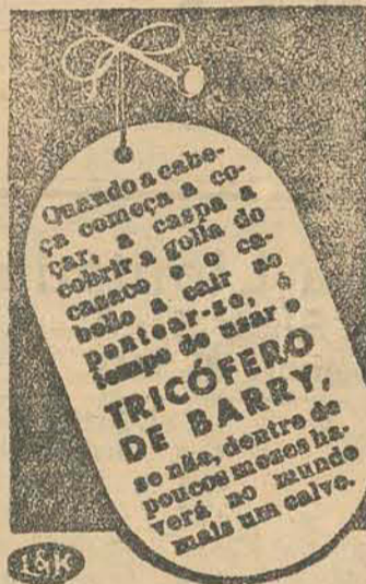
Quando a cabeça começa a coçar, a capsa a cobrir a gola do casaco e o cabelo a cair, ao Tricófero De Barry, se não, dentro de poucos meses haverá no mundo mais um calvo.

SEMPRE UM BOM ESPETÁCULO NO MAIOR CONFORTO