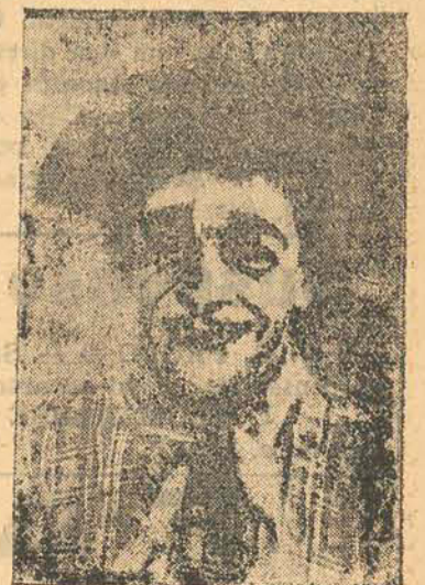
REI DO RISO