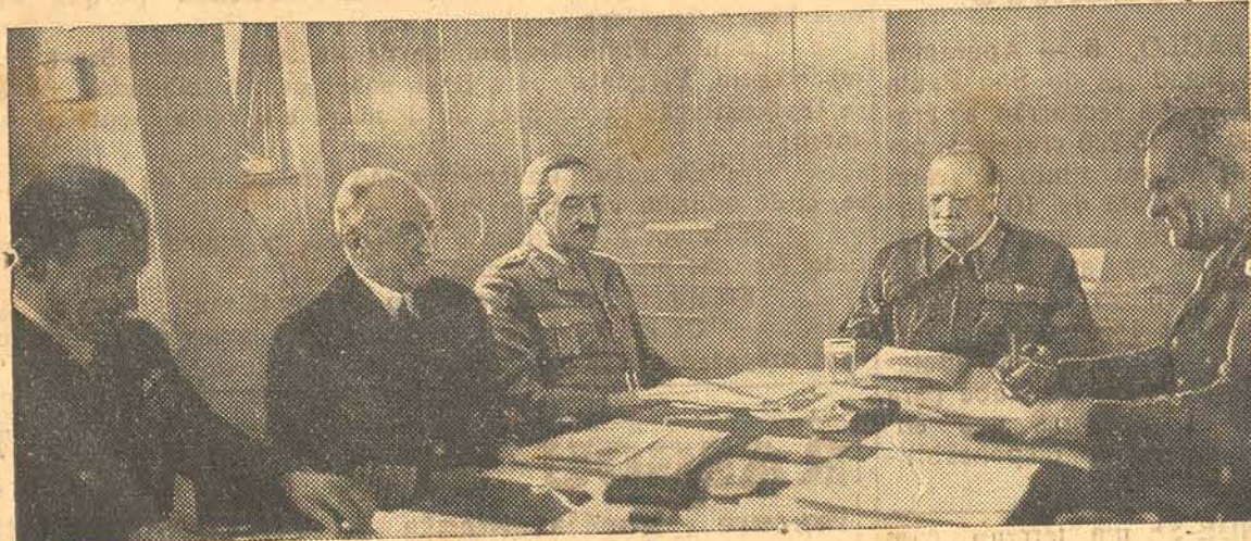
O PRIMEIRO MINISTRO BRITANICO A BORDO DA POSSANTE UNIDADE DA HOME FLEET QUE TRANSPORTOU S. EXCIA. AOS ESTADOS UNIDOS. (B. N. S.)