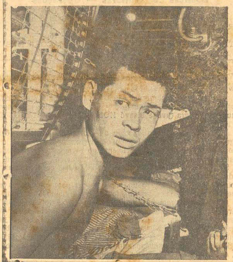
PRISIONEIRO DE GUERRA—Um piloto japonês, cujo aparelho foi derrubado no Pacífico por aviadores norte-americanos, foi surpreendido pelo fotografo a bordo do navio de guerra que o salvou das ondas.

Q. G. Aliado na Argelia, 5 (U.P.)—O 3º Exército continúa avançando, tendo desembarcado reforços em Termoli, localidade capturado ontem pelos britânicos.