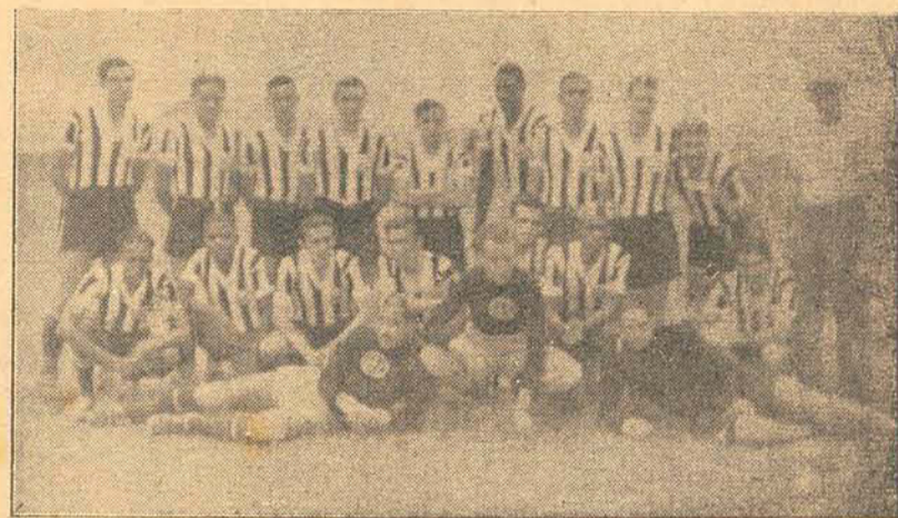
OS VALOROSOS PLAIERS DA REPRESENTAÇÃO DE GOIAS, POSAM ESPECIALMENTE PARA "GAZETA ESPORTIVA"

S. PAULO, 2 — Ainda nesta quinzena a equipe feminina de Basquete do São Paulo embar-