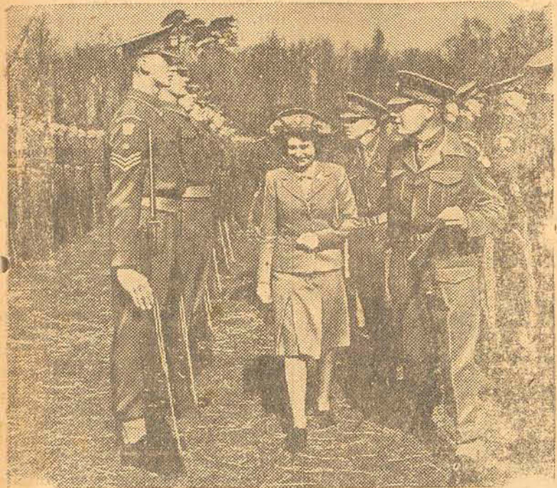
AQUI VEMOS A PRINCESA ELIZABETH, CORONEL DA GUARDA DE GRANADEIROS, INSPECIONANDO UM BATALHÃO