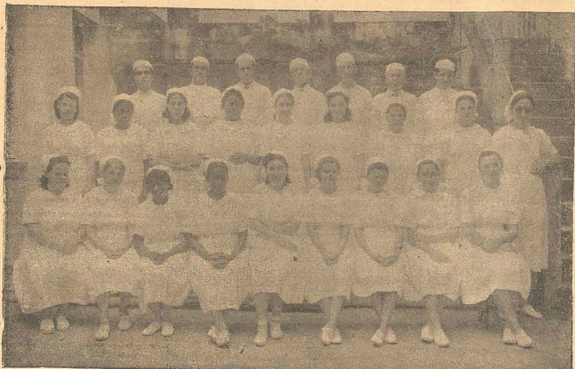
As enfermeiras do Hospital de Caridade, usando os uniformes mandados adotar pela nova administração daquela casa.

O HOSPITAL DE CARIDADE ESTÁ REMODELANDO TODOS OS SEUS SERVIÇOS