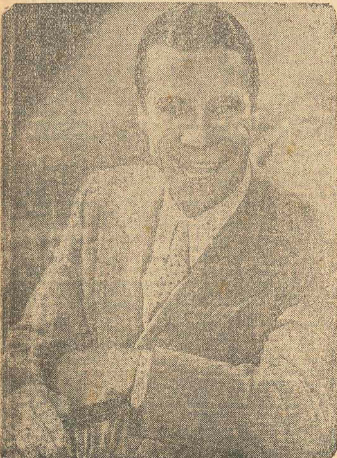
JOE E. BROWN — O Boca Larga

DOROTHY LAMOUR de sarog, cantando e encantando e que na hora "H" bancou a espartinha e passou o "conto da escrava" nos dois sábidos quando eles se preparavam para aplicar o "conto do vigário!"