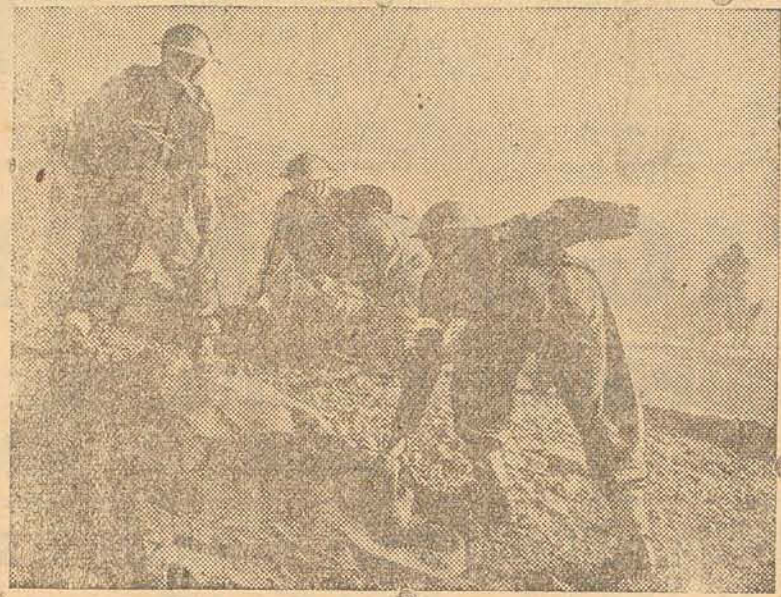
A fotografia mostra-nos uma unidade do INDIAN MEDICAL SERVICE operando, em plena luta, por ocasião da investida contra a linha do Etna.