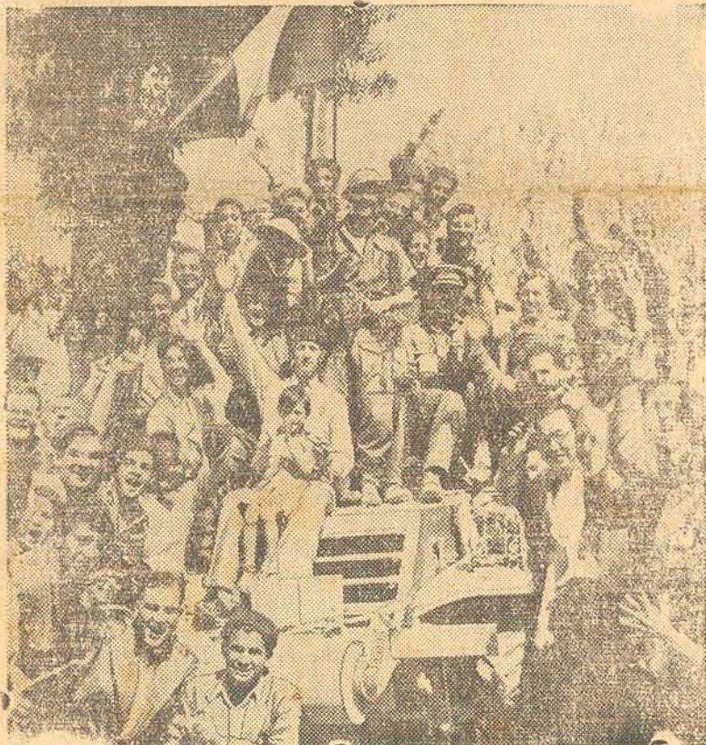
O 8º Exército é recebido com alegria pelo povo italiano

O Setimo Exército Americano entrou vitorioso na cidade de Messina, enquanto o 8º Exército Britânico e tropas de comando desembarcaram a 15 quilômetros de Reggio di Calabria