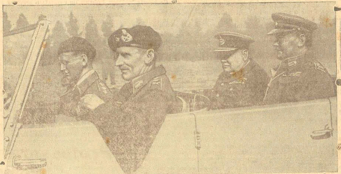
CHURCHIL VISITA E AGRADECE AS TROPAS DA NOVA ZELANDIA QUE TOMARAM PARTE NA VITORIOSA CAMPANHA ALIADA NA FOTOGRAFIA VEMOS O MINISTRO CHURCHIL O COMANDANTE DAS TROPAS DA NOVA ZELANDIA GENERAL BERNARD FREYBERG E O GENERAL MONTGOMERY

Vendem-se os bem montados e afreguezados «Bar» e Armazem Oriente, sito à rua Vitor Meireles 11, nesta capital.