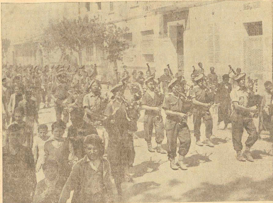
A FOTOGRAFIA DA-NOS UM ASPECTO DA FESTIVA ENTRADA DO OITAVO EXERCITO EM CATANIA, TENDO A' FRENTE UM GRUPO DE MUSICOS DA FAMOSA 510. DIVISÃO ESCOCESA.

"Entretanto, não devemos esperar que essa rebelião venha muito cedo. O fato é, ainda, que um pequeno número de homens armados pode dominar uma multidão desarmada. Mas as cartas dos cidadãos de Pantelaria indica que quando as forças aliadas começarem a penetrar na península, provavelmente terão uma calorosa acolhida".