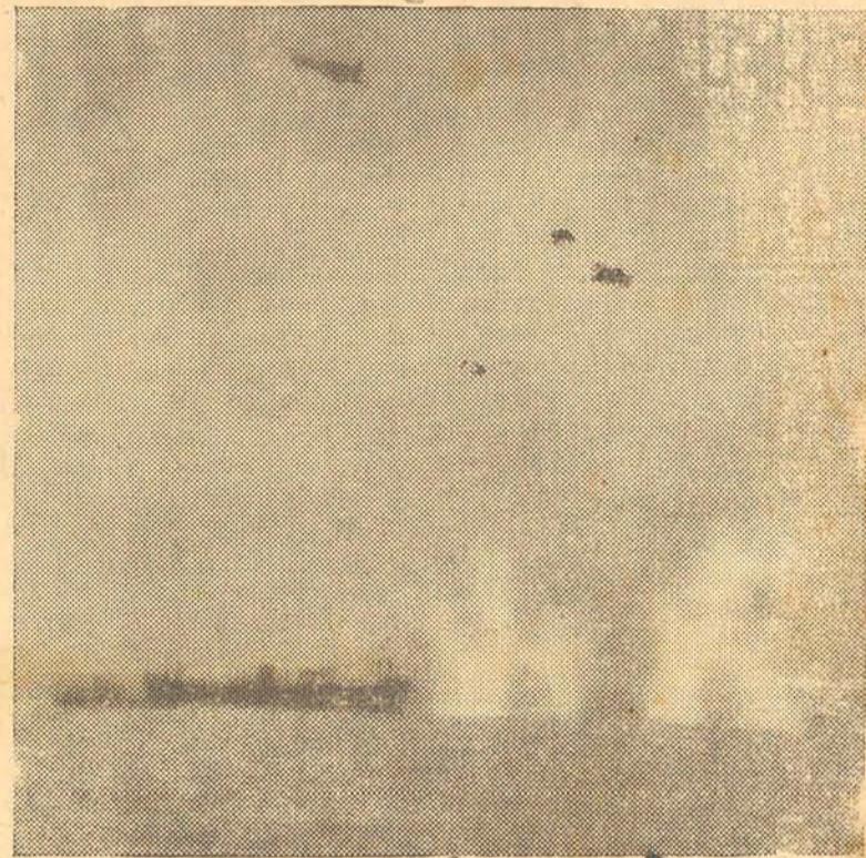
Fotografia tomada quando do bem sucedido ataque do Comando de Bombardeio contra um comboio nazista, ao largo da costa da Holanda.