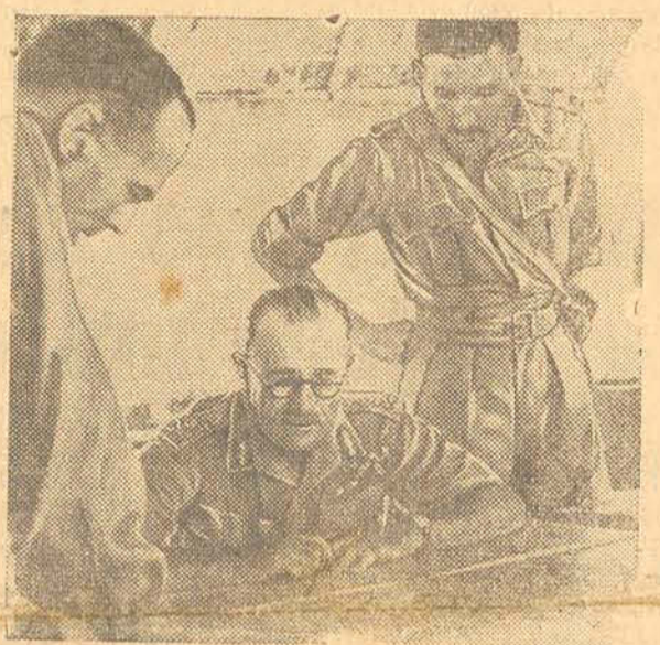
No Q. G. da Raf estuda-se a situação

Londres, 7 (R)—Um comentarista da Raf, ao fazer um resumo da participação da aviação na campanha da Sicília, revelou que as formações aéreas do Mediterraneo efetuaram mais de 7 mil saídas — vôos individuais—durante a semana que precedeu o desembarque, das quais 3 mil foram de bombardeio. Destas saídas de bombardeio, 2 mil foram destinados a atacar os aerodromos do eixo, na Sicília. Durante a semana que começou a 10 de julho, realizaram-se mais de 15 mil saídas, foram arrojadas mais de 6 mil toneladas e foram destruídos mais de 300 aparelhos inimigos. A Luftwaffe, incapaz de lutar á luz do dia, recorreu aos ataques noturnos contra os navios aliados, mas durante a semana que se seguiu ao começo dos desembarques, os caças noturnos com base em Malta abateram 46 aparelhos inimigos. Estes caças, nas três primeiras semanas de invasão, destruíram um total de 86 aparelhos do eixo.