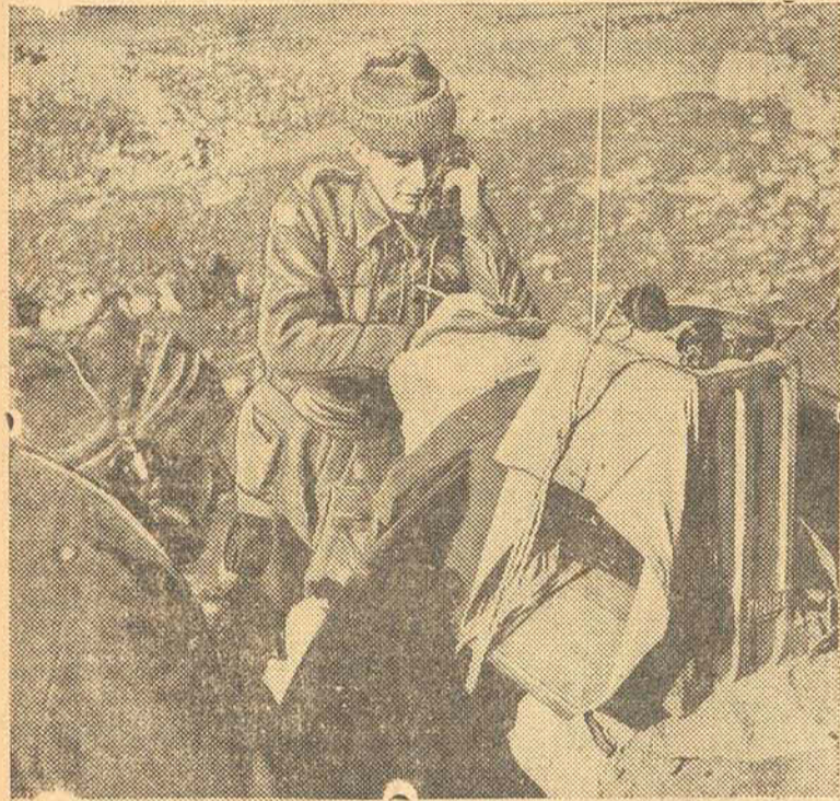
Soldados britânicos do serviço de comunicações trabalham ativamente na ligação das várias companhias e batalhões aliados depois da gigantesca investida das Nações Unidas contra a Sicília.