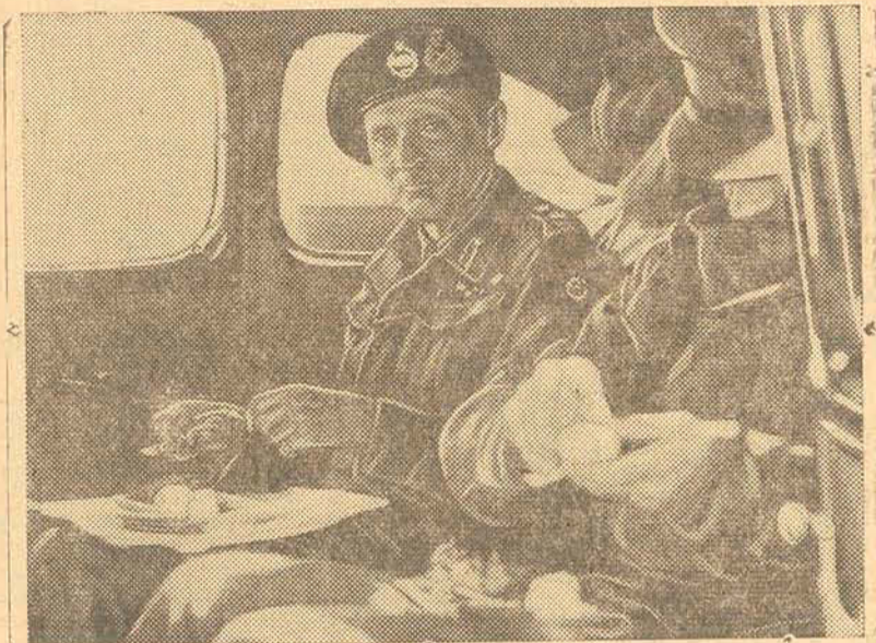
A FOTOGRAFIA SURPREENDEU MONTGOMERY A TOMAR UMA TIPICA REFEIÇÃO DE SOLDADO DO OITAVO EXERCITO: BIFE E BATATAS EM CONSERVA.

alugar boa casa de preferencia mobiliada. Cartas para M. O. — Restaurante Perola