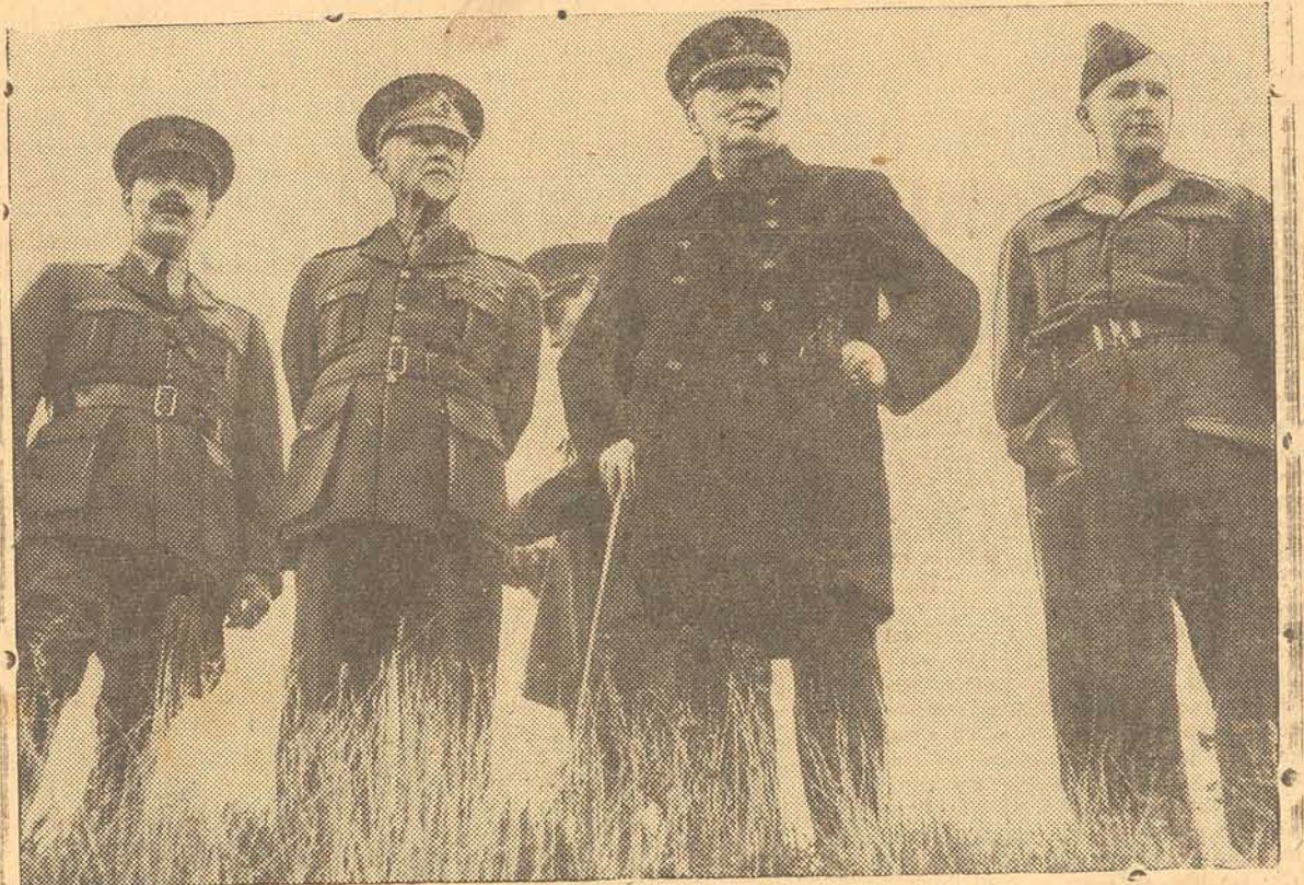
CHURCHIL MOSTRA AO GENERAL SMUTS AS DEFESAS DA REGIÃO SUL-OCIDENTAL DA INGLATERRA, QUANDO DA VISITA DESTA ULTIMO A' GRÃ-BRETANHA.