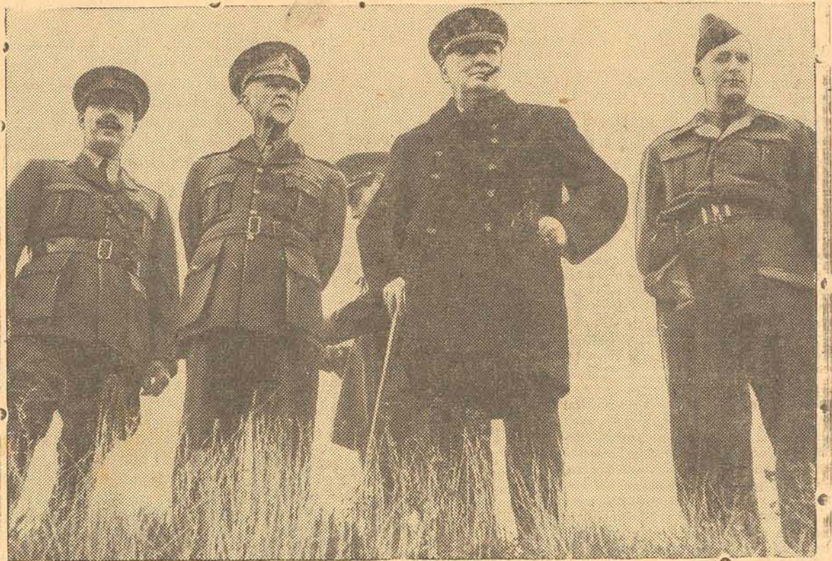
CHURCHILL MOSTRA AO GENERAL SMUTS AS DEFESAS DA REGIÃO SUL-OCIDENTAL DA INGLATERRA, QUANDO DA VISITA DESTA ULTIMO A' GRã-BRETANHA.