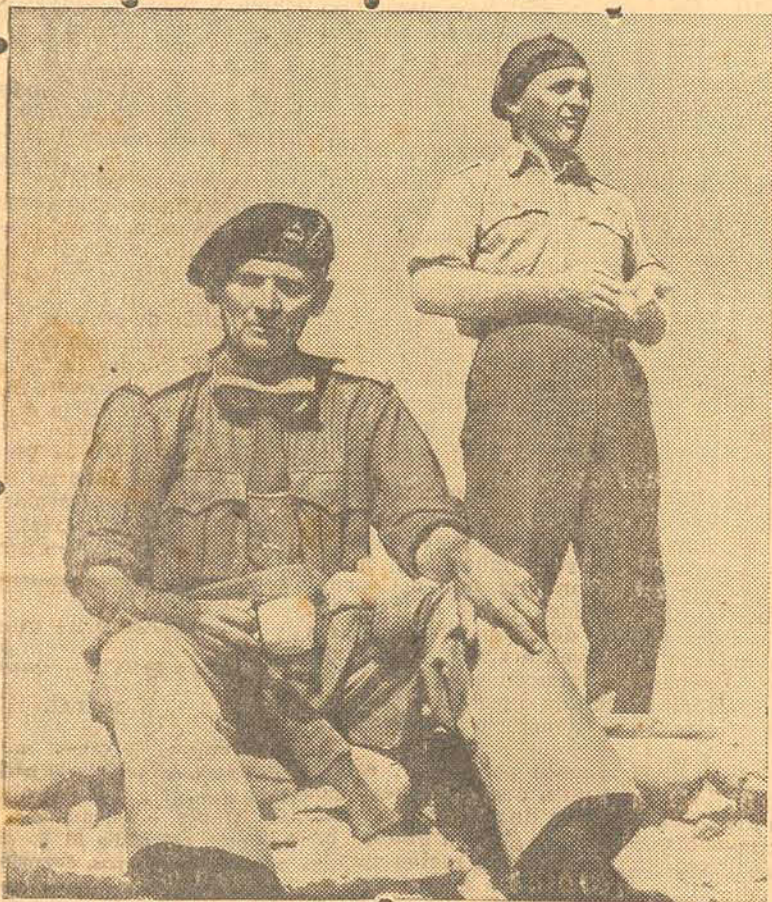
O tenente-general Sir Bernard Montgomery, que dirige o ataque à Catania.