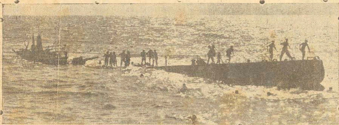
A GRAVURA MOSTRA-NOS UM ASPECTO DRAMATICO DA TRIPULAÇÃO. DE UM SUBMARINO ITALIANO DESTRUIDO POR SIMPLES 'TRAWLERS' BRITANICOS QUANDO A MESMA COMPLETAMENTE DOMINADA PELO PANICO SE ATIRAVA AO MAR, PARA ESCAPAR COM VIDA.

O Presidente da República, tendo em vista o disposto no art. 1º do decreto-lei n. 4.937, de 9 de novembro de 1942 e o que consta da Exposição de Motivos n. 433, de 17 de junho de 1943, do Ministério do Estado dos Negócios da Guerra, e usando da atribuição que lhe confere o art. 74, letra A da Constituição, decretou: