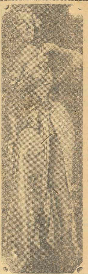
ANN SHERIDAN , danzando uma ondulante e diabolica «hawaiana». No estonteante filme: As Namoradas da Marinha

A Paramount apresenta ALMA TORTURADA (THIS GUN FOR HIRE)