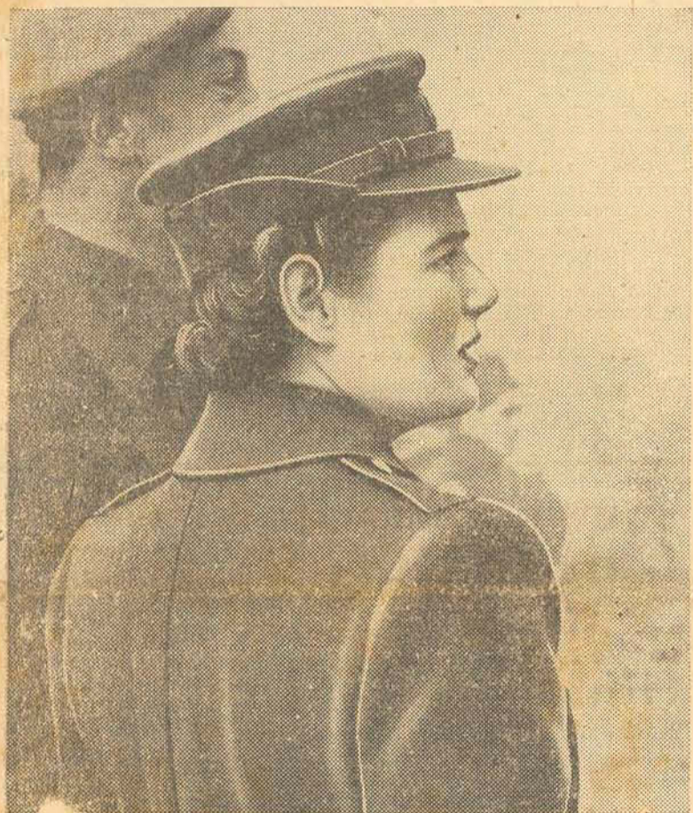
MARY CHURCHILL—A jovem filha de Churchill acompanha seu pai em uma inspeção aos novos métodos de treinamento da infantaria britânica