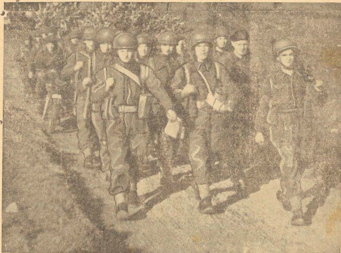
A gravura mostra-nos uma operação de consolidação levada a efeito por um destacamento de paraquedistas do Oitavo Exército, em determinado setor do campo de batalha da Tunisia