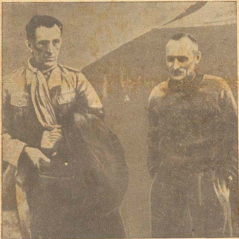
QUEM PARECE SER VENCEDOR? — Montgomery, após uma de suas mais brilhantes vitórias no Deserto Ocidental, avista-se com o general Ritter von Thoma, prisioneiro em consequência da derrota do Afrika Korps.

LONDRES, 2 (R.) --- EXASPERADO COM OS CONSECUTIVOS E DEVASTADORES ATAQUES DA AVIAÇÃO ALIADA, QUE ESTÁ CAUSANDO CONSIDERAVEIS DANOS, O GOVERNO EIXISTA DETERMINOU QUE NOS ATAQUES À INGLATERRA SEJAM EMPREGADOS GAZES ASFIXIANTES --- É O QUE SE PROPALA NOS CÍRCULOS NEUTROS.