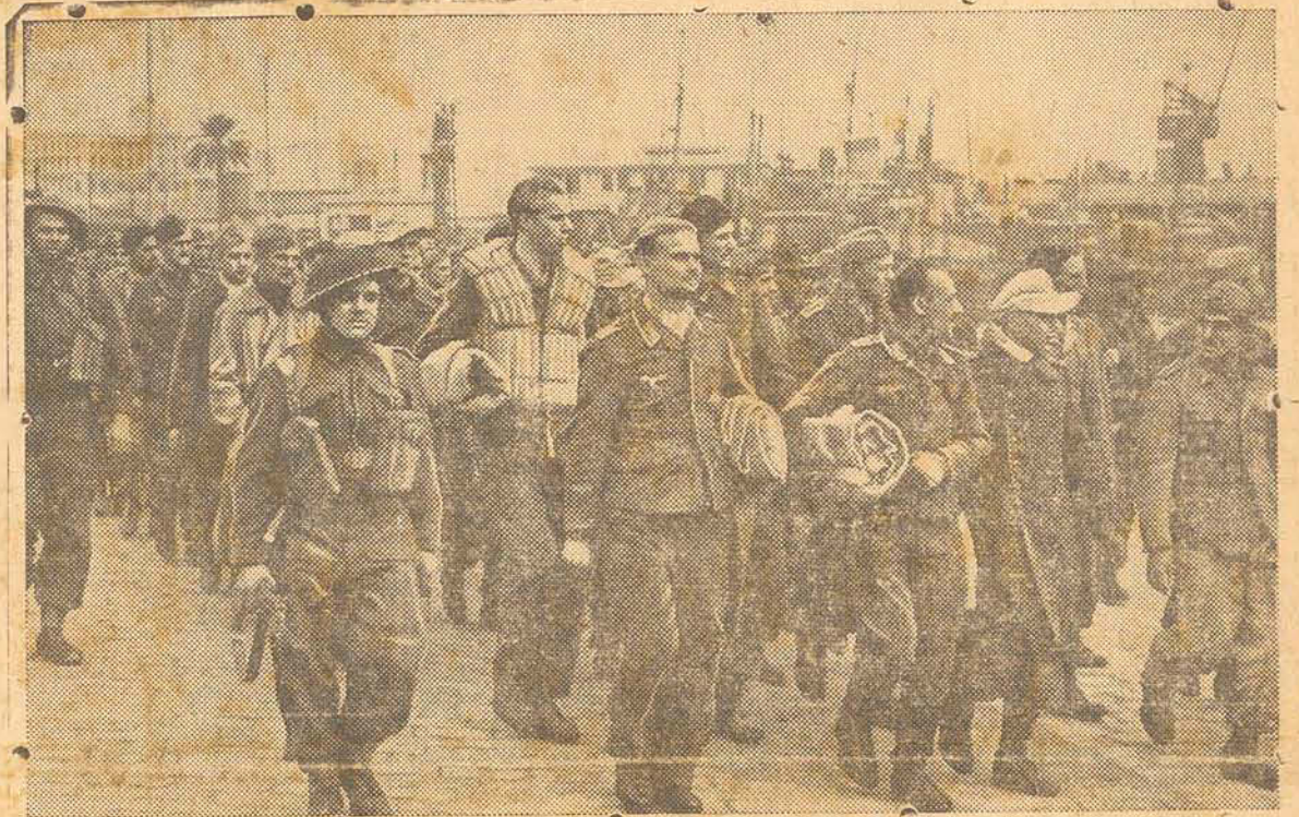
PRISIONEIRO NAZISTAS CHEGAM CONSTANTEMENTE AO POSTO DE CONCENTRAÇÃO DAS NAÇÕES UNIDAS