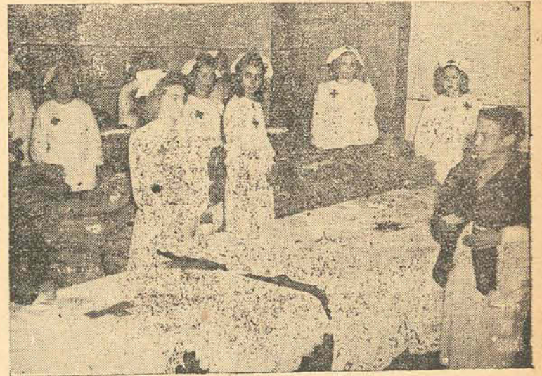
Incansáveis e dedicadas samaritanas da Cruz Vermelha distribuindo víveres e roupas aos pobres.

4 clarins de metal amarelo. Informações com R. V. nesta Redação.