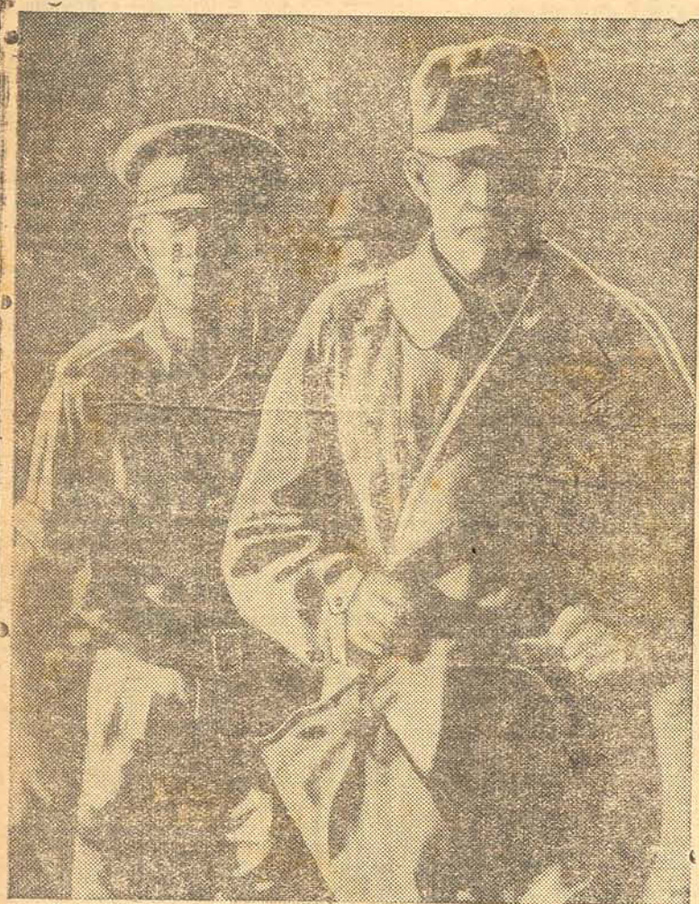
O general Ritter Von Thoma, comandante do Africa Korps, depois de capturado pelas forças britânicas durante a sua vitoriosa avançada através do deserto africano.

Um cmte. do Afrika corpus capturado durante a retirada de Rommel