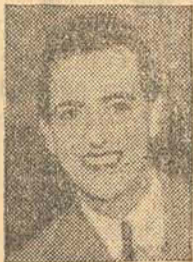
Hugo del Carril