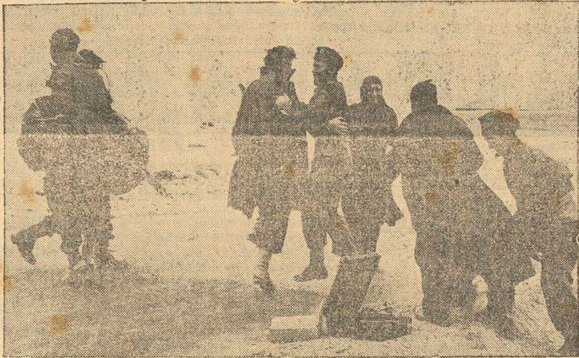
NAS HORAS DE FOLGA, MESMO SOB O TROAR DOS CANHÕES, A LEGIÃO SE DESERTO SE DIVERTE, AO SOM DE UMA ANTIQUADA VITROLA.