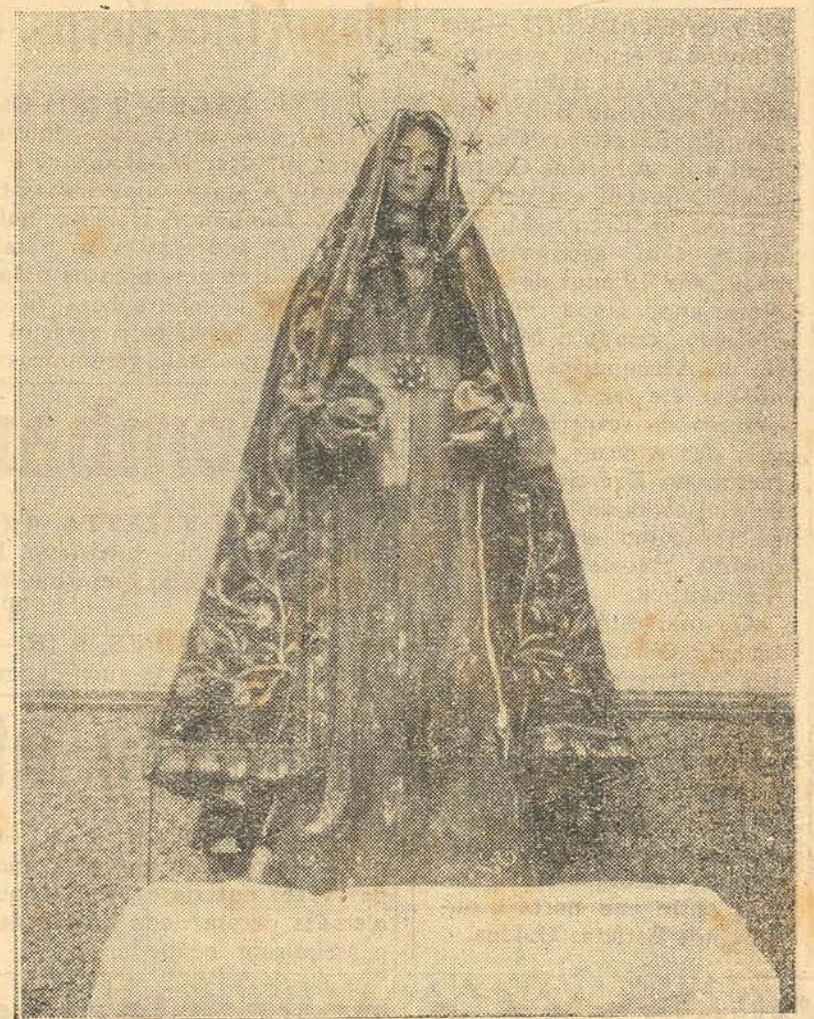
Imagem de Nossa Senhora das Dores