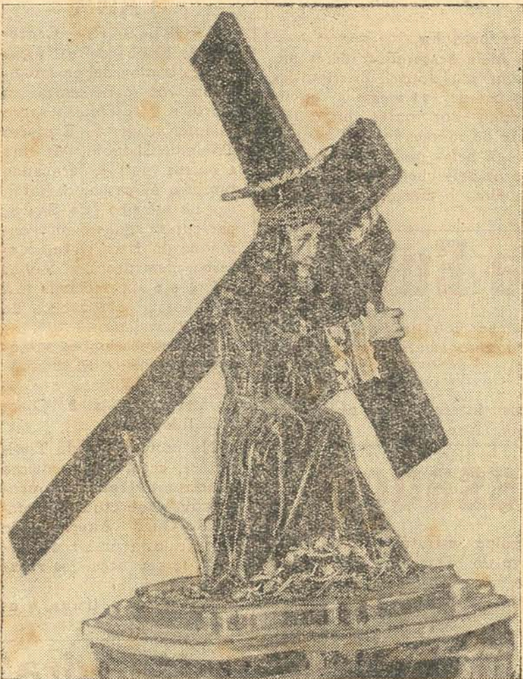
Imagem do Senhor Jesus dos Passos