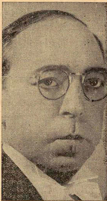
Sr. Interventor Federal dr. Nerêu Ramos

O intento desses servidores do Estado é manifestar de forma pública e flagrante, a sua admiração e os seus respeitosos sentimentos de disciplina, e dedicação ao Chefe da Nação Brasileira e ao seu preclaro delegado no Estado de Santa Catarina.