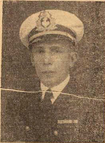
Excm. sr. Comandante Plínio da Fonseca Cabral, Capitão dos Portos e Juiz da festividade

Culminam hoje as solenidades em honra de Nossa Senhora dos Navegantes, na Igreja de São Sebastião, no lindo arrabalde da Praia de Fóra.