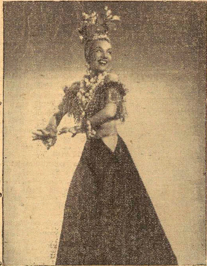
Carmen Miranda em "UMA NOITE NO RIO"

—Alguem foi a convite do diretor IRVING CUMMINGS fazer aquela pergunta aos astros de UMA NOITE NO RIO. —O que é que acham do Rio de Janeiro?