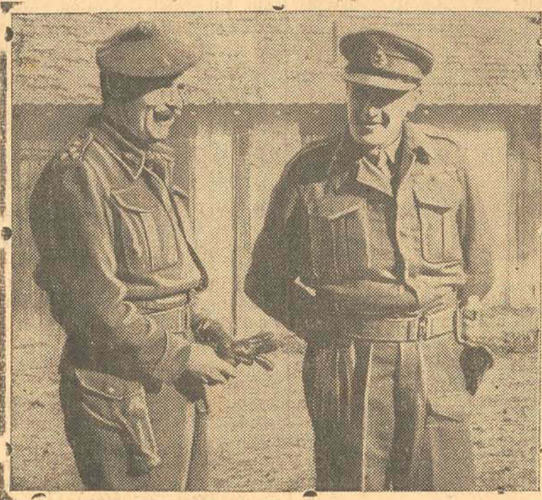
O TENENTE-GENERAL K. A. N. ANDERSON VISITA AS SUAS TROPAS — Na gravura vemos o tenente-general K. A. N. Anderson o comandante do Primeiro Exército Britânico, á direita, em visita, a um dos postos divisionais de comando daquele já famoso Exército britânico de ultramar.

LONDRES, 29 (U P)—Segundo informa a rádio alemã, aviões aliados atacaram, domingo, a ilha de Stampalia, no Dodecaneso. É a quarta vez que a aviação aliada ataca aquela ilha, desde que os alemães a ocuparam, em outubro. Stampalia está a cerca de 30 milhas da ilha de Cos.