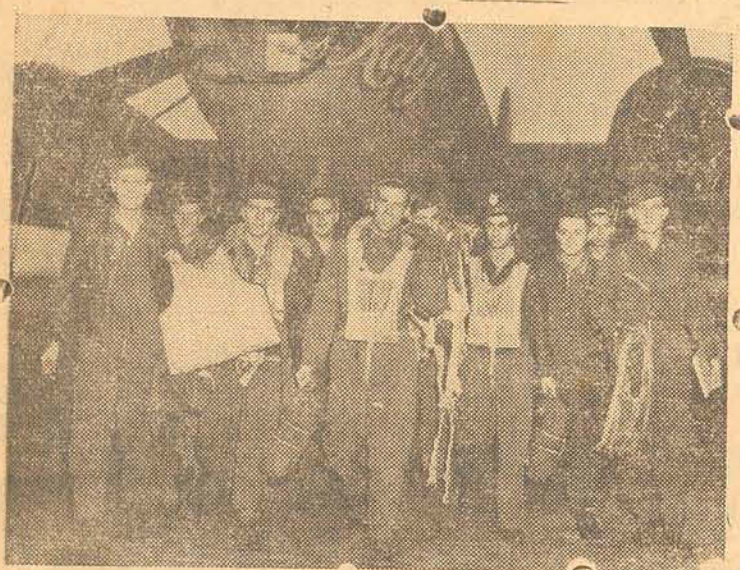
Tripulantes de uma Fortaleza Voadora estadunidense depois de aterrisar em uma base da Inglaterra de regresso de um ataque á luz do dia contra a Alemanha. Estes raides estão desmantelando a industria e o moral germanico.