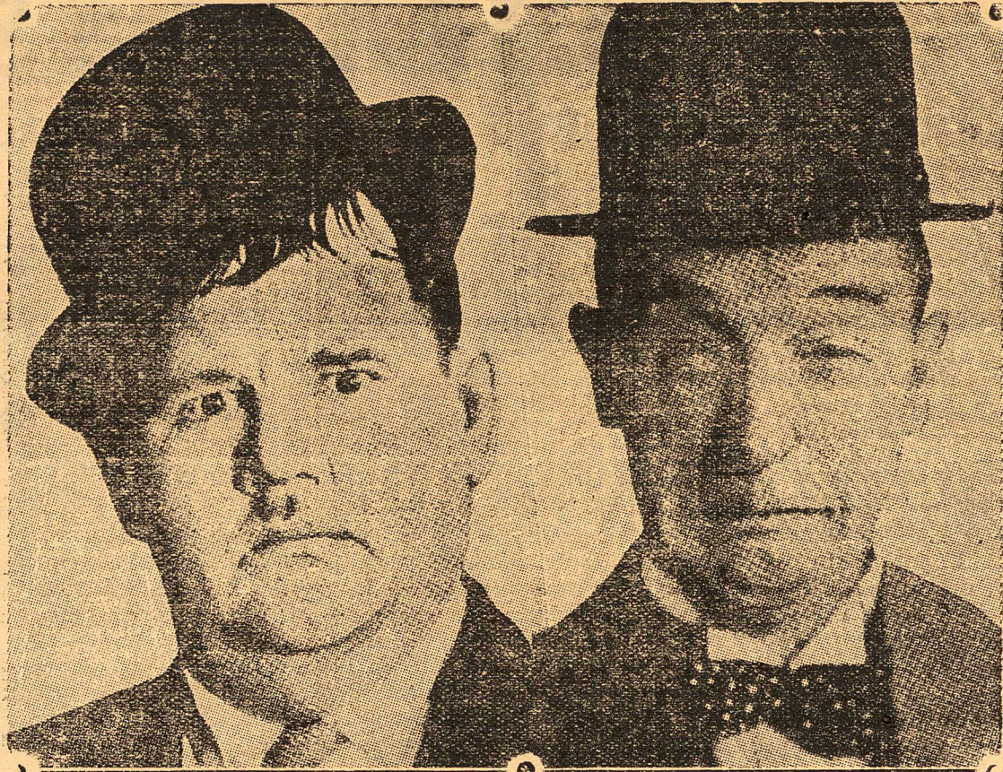
OLIVER HARDY (O gordo) e STAN LAUREL (O magro)