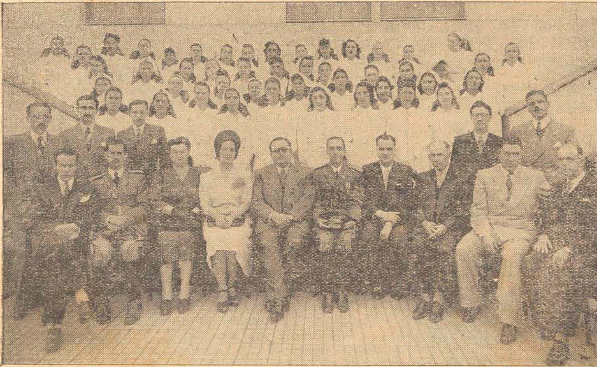
As Samaritanas desta capital e os diretores da Cruz Vermelha em Santa Catarina

No quadro das organizações que, em Santa Catarina, vêm acorrendo ao apelo desta hora angustiosa para a Nação e para a humanidade a Cruz Vermelha Brasileira se inclui entre as mais altruísticas e patrióticas. O apoio que lhe tem dado todas as classes sociais, o prestígio de que a cercam os poderes públicos e o povo catarinense, correspondem, certamente, ao nobre objetivo dessa instituição cívico-humanitária, a qual reúne em seu seio figuras de realce em todos os setores de atividades do Estado. É numerosa pleiade de senhoras e senhoritas confiadas aos mestres que se lhes assinalarão, a pród da Pátria e do Bem.