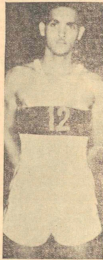
TAVARES DO AVAI

Para a noite de hoje, em prosseguimento ao emocionante torneio promovido pela F. A. C., está marcada a peleja entre as representações invictas do AVAI e LICEU INDUSTRIAL.