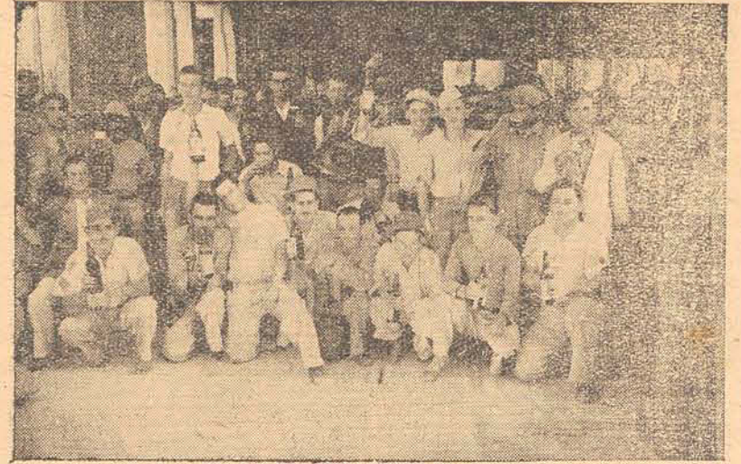
OPERARIOS ENCARREGADOS DA CONSTRUÇÃO DO PRÉDIO DO BANCO INCO

o INCO, que constrói aqui uma sede própria, num edifício que está orçado em mais