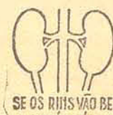
SE OS RINS VÃO BEM A SAÚDE É BOA

• Para a perfeita conservação do seu carro, o Sr. esmera-se em trazê-lo sempre limpo. Com mais forte motivo deve cuidar da conservação do organismo, fazendo, periodicamente, a limpeza e desinfecção dos rins com HELMITOL de Bayer. • Do perfeito funcionamento do aparelho renal depende, em grande parte, a saúde presente e uma velhice forte, sadia e livre de achaques.