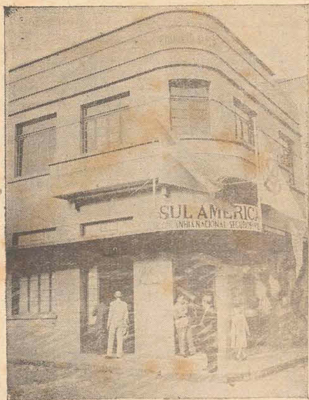
A SUCURSAL DA SUL AMERICA DE SANTA CATARINA

fazendo sentir que te do interior do nosso Estado o bjetivo da Cia. em edificar e que trizou a preocupação dos di-