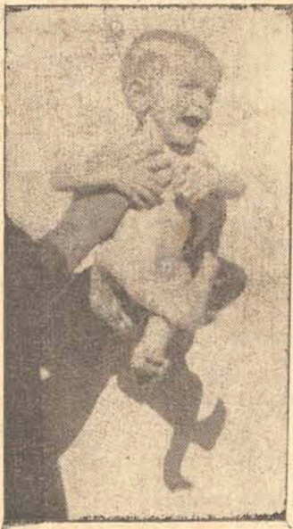
A CRIANÇA QUE FOI OPERADA

Contando apenas 10 meses de idade e já em adiantado estado de desnutrição foi ha dias, socorrida, no Hospital de Caridade uma criança, e já se acha fóra de perigo. Mais uma vez prestou serviços, o aparelho de esofagospia, doado pelo Governo do Estado. O botão que fechava o esofago já foi eliminado e a criança voltou a se alimentar.